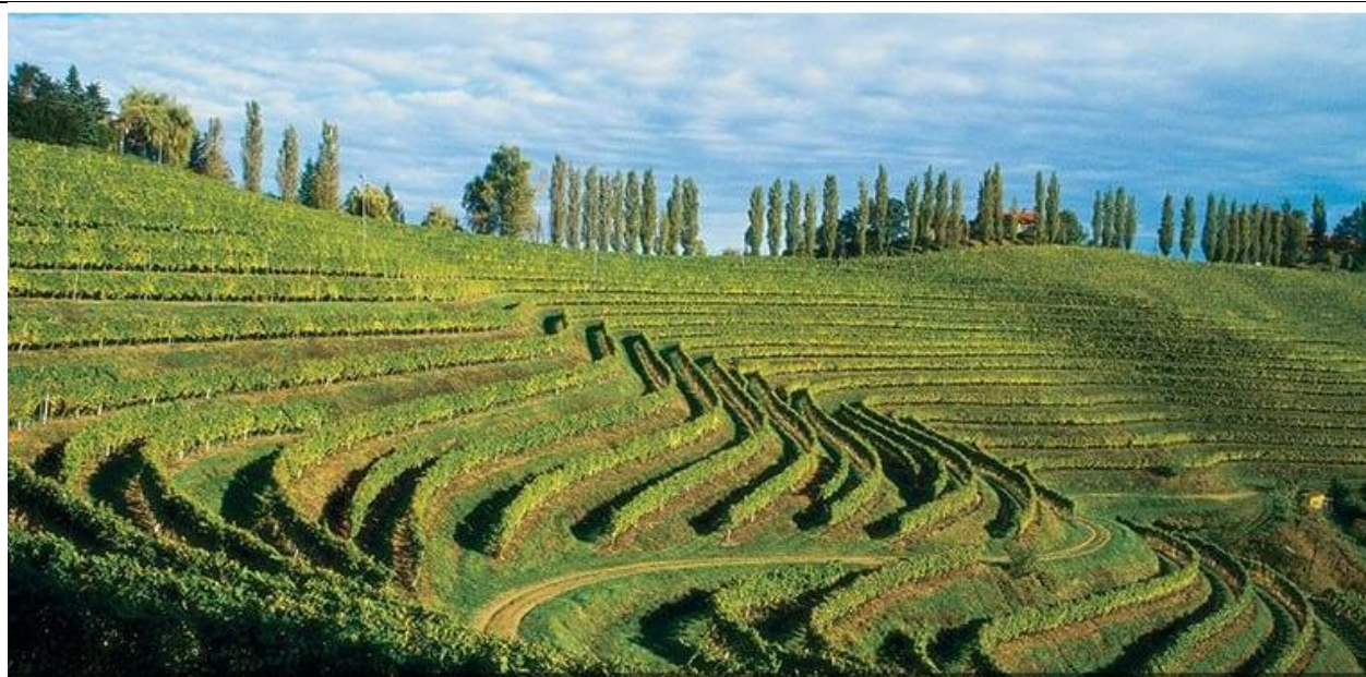
Le vignoble slovène